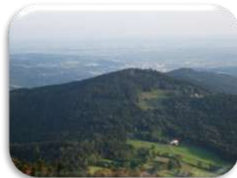
Blick über den Butzen nach Deggendorf