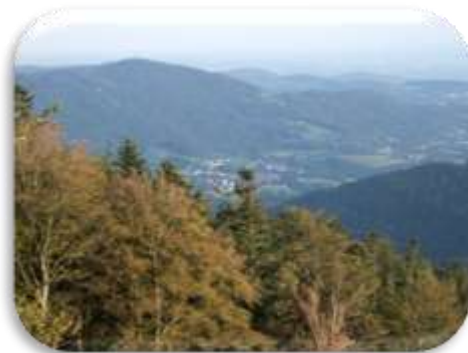
Blick ins Graflinger Tal