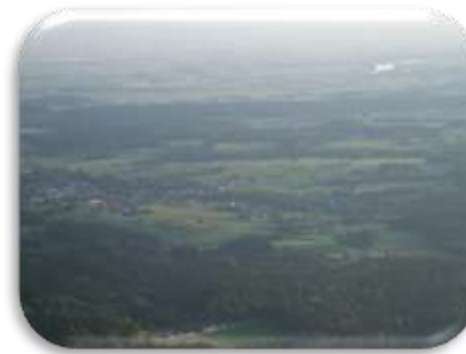
Blick über Edenstetten ins Donautal

Nach der kurzen Rast geht es weiter über den Wanderweg bergabwärts. Der Weg ist steinig und verlangt gutes fahrerisches Können. Vorsicht bei nassem Wetter. Nach ~ 750 m erreichen wir die Forststraße und biegen links ab. Weiter geht's talabwärts. Wir folgen der ersten Kehre nach ~ 400 rechts, nach weiteren gut 150 m biegen wir scharf links ab und fahren die Forststraße weiter bergab und kommen nach ~ 1,1 km an die nächste Biegung (~1,1 km) der wir nach rechts folgen. Nach weiteren ~ 500m biegen wir links ab (talwärts) und gelangen nach gut 1 km an die Gemeindeverbindungsstraße. Wir biegen links ab (Bild 11) und gelangen nach knapp 5 km über Oberhirschberg, Endbogen und Graßlingsberg zurück zum Ausgangspunkt zur Ortschaft Grafling. Diese Tour kann auch in umgekehrter Richtung gefahren werden.